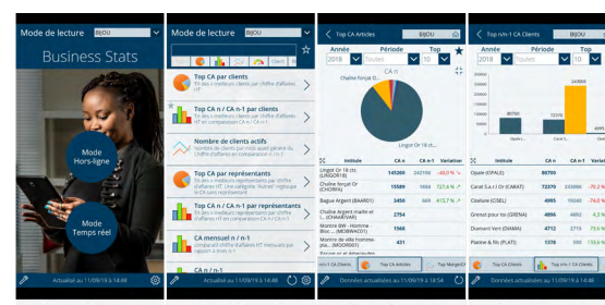
Consultation en temps réel ou en mode Hors Ligne de vos statistiques de vente clients et articles.

Consultation/modification des informations clients et contacts, consultation des documents de vente, ajout de photos à un document ou à un client, validation de devis par signature électronique, utilisation de l'intelligence artificielle pour créer un contact ou un prospect depuis une carte de visite.